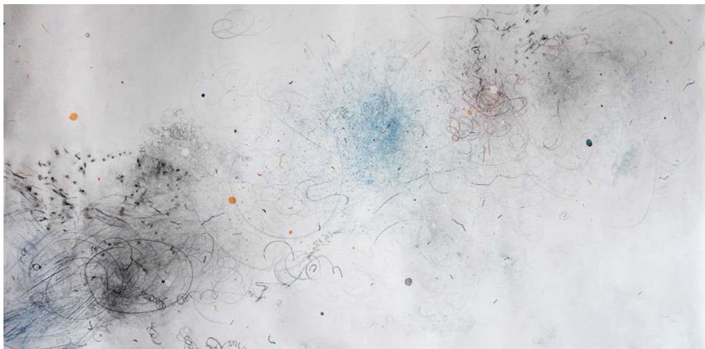
GÜNSU HAYRIYE OZAN- 2022