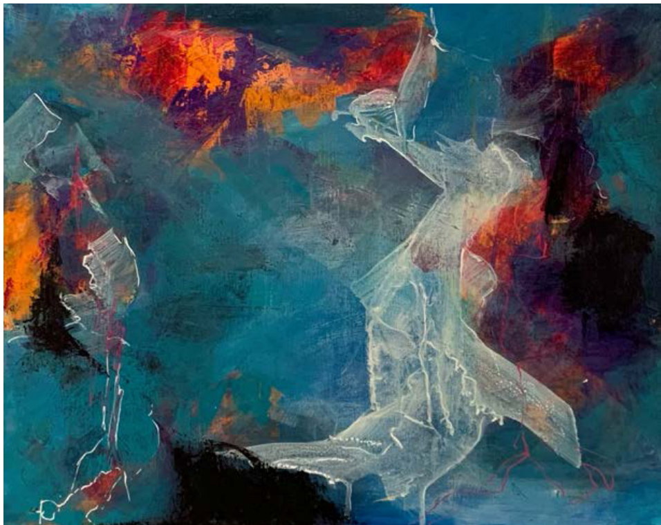
PAM BIXEL - 2022