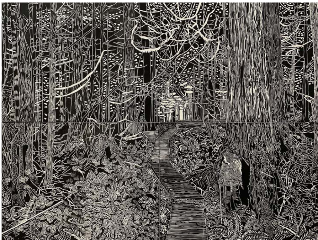
SIOBHAN ARNOTT- 2022